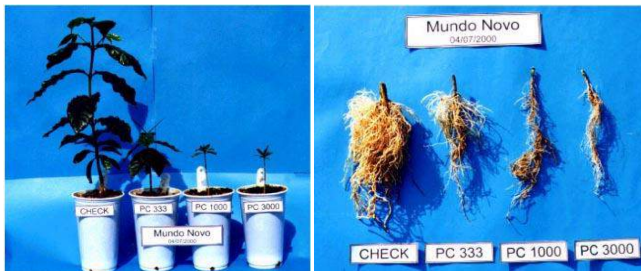
Figura 2. Efecto de diferentes densidades poblacionales de Pratylenchus coffeae en Coffea arabica cv Mundo Novo a los 244 días posteriores a la inoculación. Créditos: Roberto k. Kubo y colaboradores.