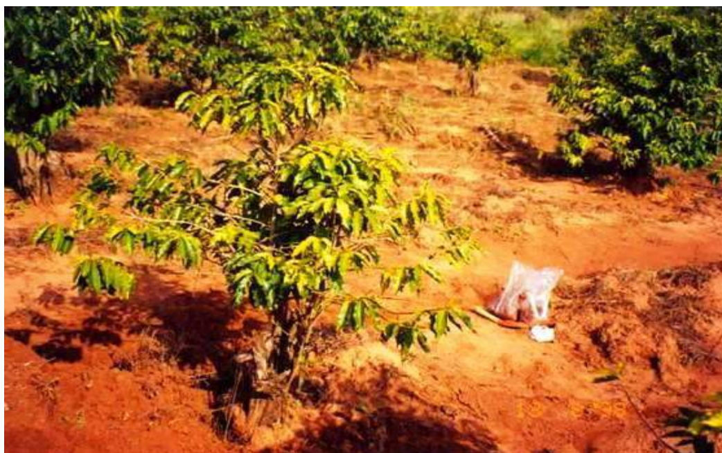
Figura 3. Síntomas causados por Pratylenchus coffeae en plantas adultas de Coffea arabica .