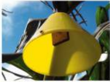
Fig. 2. Reference bait station, or LUT, with a cotton sock soaked in Spynis-aggel

La capacidad de vuelo (tanto velocidad y distancia) cambió significativamente con la edad de la mosca, alcanzando un máximo de alrededor de los 15 d. Este estudio proporciona los datos científicos importantes para una mejor revelación del mecanismo de dispersión de larga distancia de B. dorsalis .