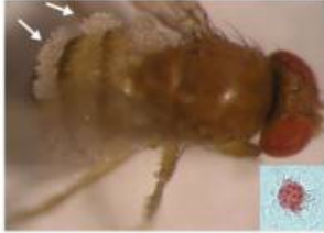
Fig. 2 Abdomen of dead D. suzukii with conidiophores of E. muscae growing out between the tergites and sclerites of the abdomen. Inset shows an E. muscae spore from D. suzukii with the characteristic Entomophthoraceae oval shape of a rounded base with a pointed apex. Several nuclei can be seen inside.