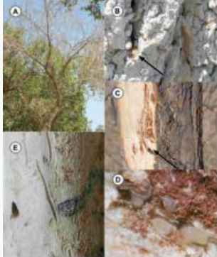
Figura 1. Daños y estados de desarrollo de Scolytus schevyrewi . A) Copa de árbol seco de Ulmus pumila en Chapingo, Eds. de México, B) Orificios de entrada con aversón en la corteza, C) Galería de oviposición en el floema con hembra, Nótese ricasas de huevecillos a lo largo de la galería, D) Larvas maduras en el floema, E) Galerías de oviposición y larvas grabadas en la albura.