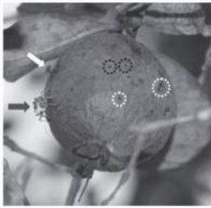
Fig. 1. Acca sellowiana fruit showing characteristic symptoms of Conotrachelus psidii attack: damage caused by feeding (black circles) and oviposition (white circles). An adult male of C. psidii is indicated by a black arrow, and an egg-laying adult female of Drosophila sp. is indicated by a white arrow.