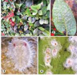
FIG. 1-3. Ixora sp. leaves infested with Asiothrix antidesmae (whitefly). Fig. 4. Whitefly, Asiothrix antidesmae .