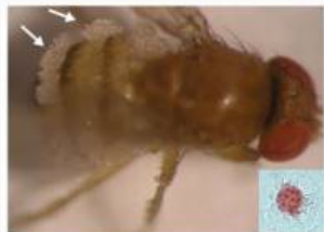
Fig. 2 Abdomen of dead D. suzukii with conidiophores of E. muscae growing out between the tergites and sclerites of the abdomen. Inset shows an E. muscae spore from D. suzukii with the characteristic Entomophthoraceae oval shape of a rounded base with a pointed apex. Several nuclei can be seen inside.